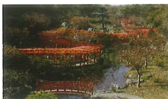
高山稲荷神社（イメージ）