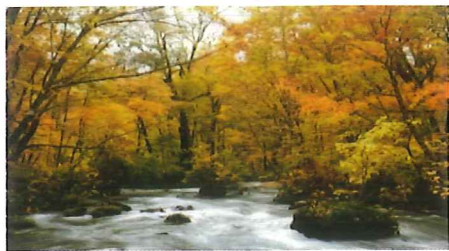
奥入瀬溪流の秋（イメージ）