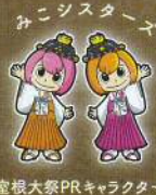
ミニシスターズ 室根大祭PRキャラクター

御輿御下り / 午前4時～神社 御輿先着争い～仮宮遷宮 / 午前7時頃～町内、祭場 祝詞奉上～御輿還幸 / 午前9時30分～祭場、町内